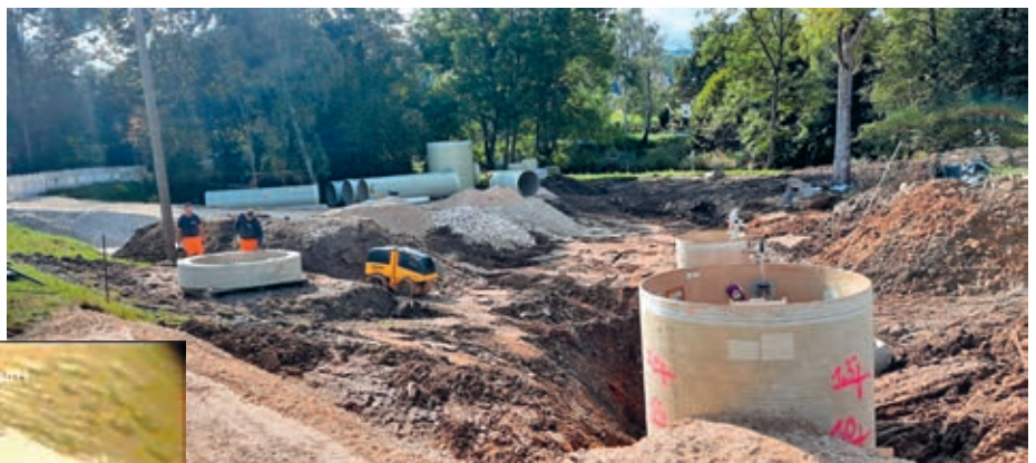
Stauraumkanal im Bereich der Kläranlage Königswalde